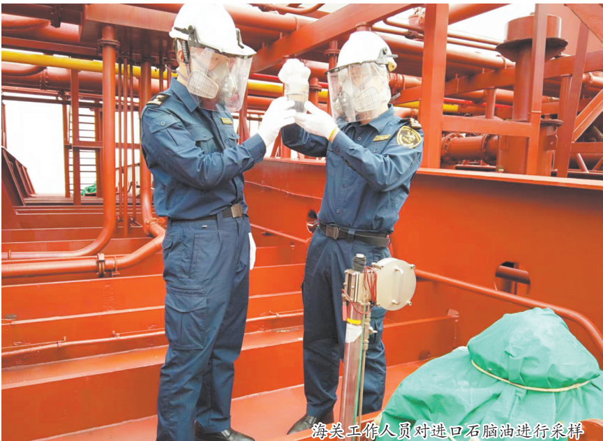
海关工作人员对进口石脑油进行采样

据统计,今年前10个月,泉州海关共监管进口石脑油24.54万吨,同比增长3倍,进口量创同期历史新高。