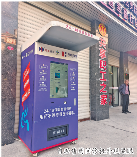
自助售药问诊机外观显眼

“作为实体药店的延伸,售药问诊机能满足群众夜间紧急用药需求,弥补夜间市场服务不足。”该工作人员表示,相关药企安排专人对设备内的药品质量、数量进行把控和管理,设备自带温湿度自动监测终端,能确保药物储存安全。