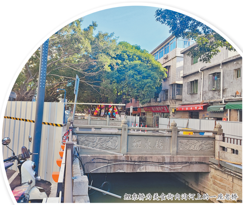
鲤东桥为美食街内沟河上的一座老桥

鲤东桥主要连通美食街泉府大第和津头埔路,桥梁封闭施工期间,周边居民如何出行?日前,丰泽交警联合丰泽区城管局发布了交通限制通告,于2023年11月17日—2024年2月13日对鲤东桥及两侧道路路口进行交通限制。交通限制期间,鲤东桥进行封闭施工,在两侧预留不少于2米宽的道路供非机动车、行人通行。鲤东桥西侧预留3.3米宽道路供附近小区车辆出入。途经该路段前往丰泽新村或者泉府大第的车辆,可以绕行津淮街或丰泽街。