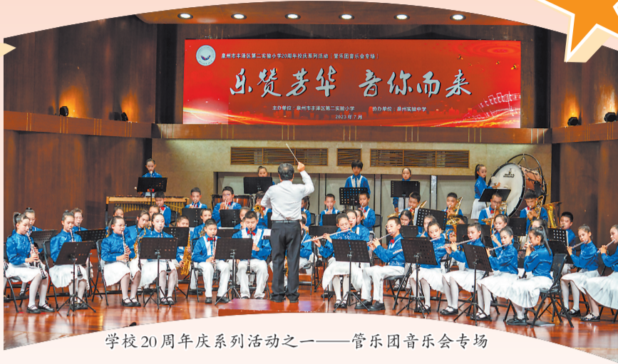
学校20周年系列庆祝活动之一——管乐团音乐会专场