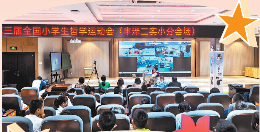
全国小学生哲学运动会比赛现场

结合儿童哲学主题开展的“和美六典”“传统五节”活动,成为学校的德育特色。“和美六典”按学生年龄特色循序渐进,如一年级“我是小学生”常规活动,二年级“我爱我家”有礼活动,三年级“我是小主人”明责活动,四年级“诚信我来讲”诚信活动,五年级“社会公德我来遵”实践活动,六年级“我爱我家”“我爱我家”感恩活动,以各年龄段特色典礼的形式呈现,在活动中培养学生参与、竞争、自强、自律的意识,学会合作、交流、做人、生存的能力。同时,学校每年设立传统五节:四月体育节、五月读书节、十月科技节、十一月英语节、十二月艺术节,将科技、读书、文体、手工制作、绘画、信息技术等活动贯穿整个活动月,为学生充分展示才能提供了平台。