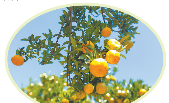
永春脐甜飘香(资料图片)

据悉,目前南安蓬华脐橙已经基本采摘结束,永春芦柑、南安乐峰的芦柑采摘期将持续到12月中上旬,南安九都的赣南脐橙采摘期将持续到12月底,想体验采摘的市民要把握时机了。