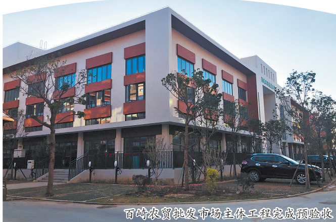
百崎农贸市场批发市场主体工程完成预验收