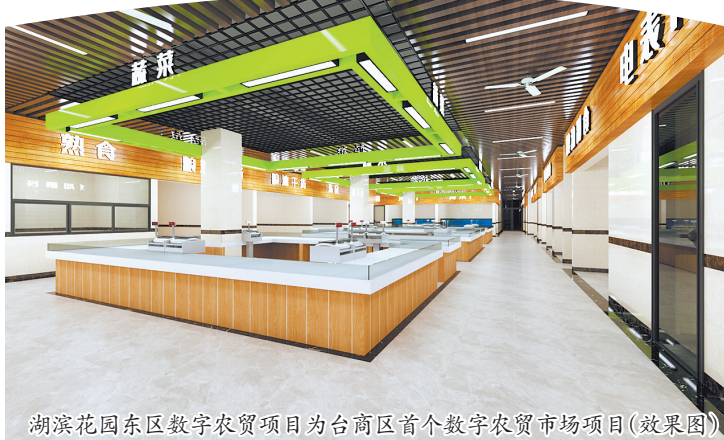
湖滨花园东区数字农贸项目为台商区首个数字农贸市场项目(效果图)