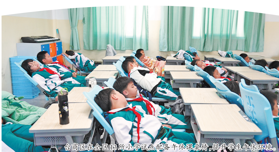
台商区在全区13所小学试点配备午休课桌椅,提升学生午休环境。

装备水平,2022年实现全区中小学近视防控教室灯光改造,同年实现全区中小学运动场100%塑化。此外,为构建“互联网+教育”新生态,发展更加公平更有质量