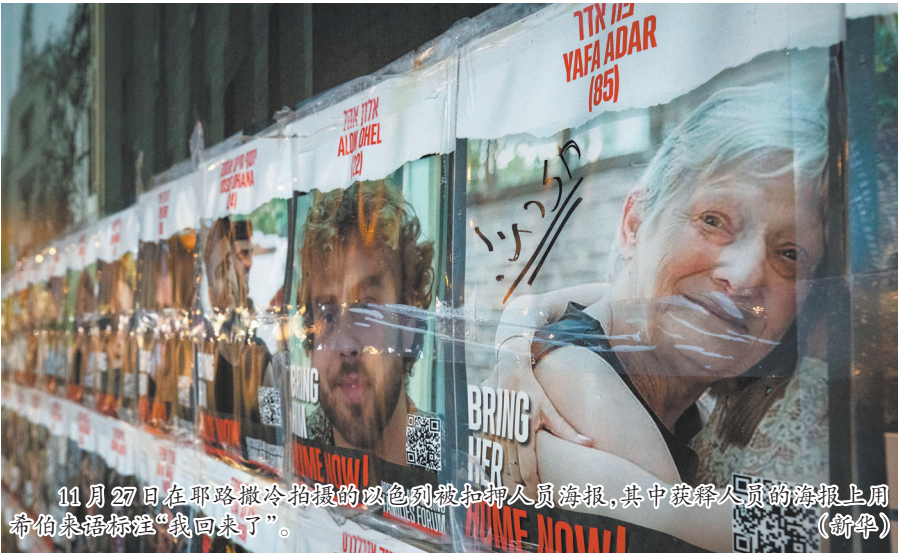
11月27日在耶路撒冷拍摄的以色列被扣押人员海报,其中获释人员的海报上用希伯来语标注“我回来了”。(新华社)

据美国有线电视新闻网、路透社等外媒28日报道,哈马斯与以色列已就延长停火协议达成一致,同意将停火期限延长