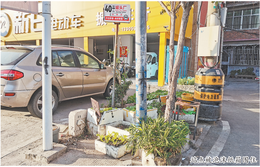
站点被泡沫纸箱围住

记者将此情况反映给泉州公交集团场站分公司和泉州公交集团经营部。泉州公交集团场站分公司相关工作人