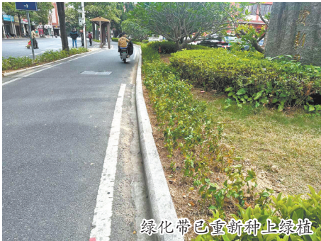
绿化带已重新种上绿植

本报讯(记者张小玲 文/图)网友“日月之约”向@96339 记者热线反映,鲤城区新门街483号前面有两处绿化带的草皮缺失,影响美观,希望部门尽快处理。上周三,本报对此事进行报道并反映给鲤城区城管局绿化办。昨日,记者到现场回访发现,原先草皮缺失的位置已经补种了绿植,绿化带看上去更加郁郁葱葱,充满生机。