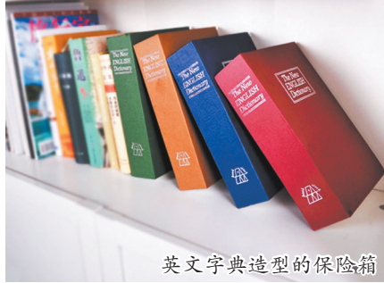
英文字典造型的保险箱

这是一个字典造型的保险箱,开锁式的设计,新颖实用。把一些宝贝放到里面,使用钥匙锁上,放到书房就是一本宝典。