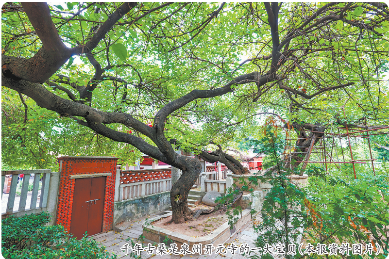
千年古桑是泉州开元寺的一大宝贝(本报资料图)