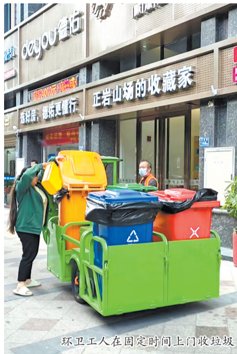
环卫工人在固定时间上门收垃圾

下一步,洛江区城市管理局将聚焦“标准化、精细化”管理目标,努力推动从“新时尚”到“常态化”的转变,充分发挥示范街的带动作用,连点成线、积线成面,打造更加干净、整洁的宜居城市。