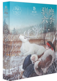
《驯鹿六季》 格日勒其木格·黑鹤 著 明天出版社