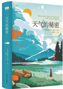
《天气的秘密》 [英] 特里斯坦·古利 著 译林出版社

很多天气征兆就在我们触手可及的地方,阅读此书,每个普通人也能为自己偶尔能洞察一部分“老天爷的秘密”而暗暗欣喜,因为,这正是我们作为自然之子不可或缺的一种技能啊。