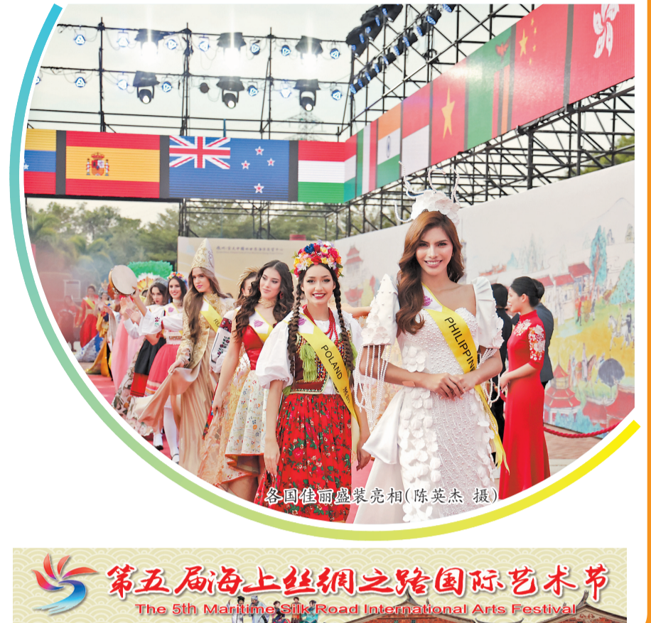
各国佳丽盛装亮相

入城仪式后,组委会还将组织进行城市采风,开展让世界寻觅泉州 City walk和让世界品味泉州“潮”等主题活动,总决赛及颁奖仪式将于12月22日在泉州举行。