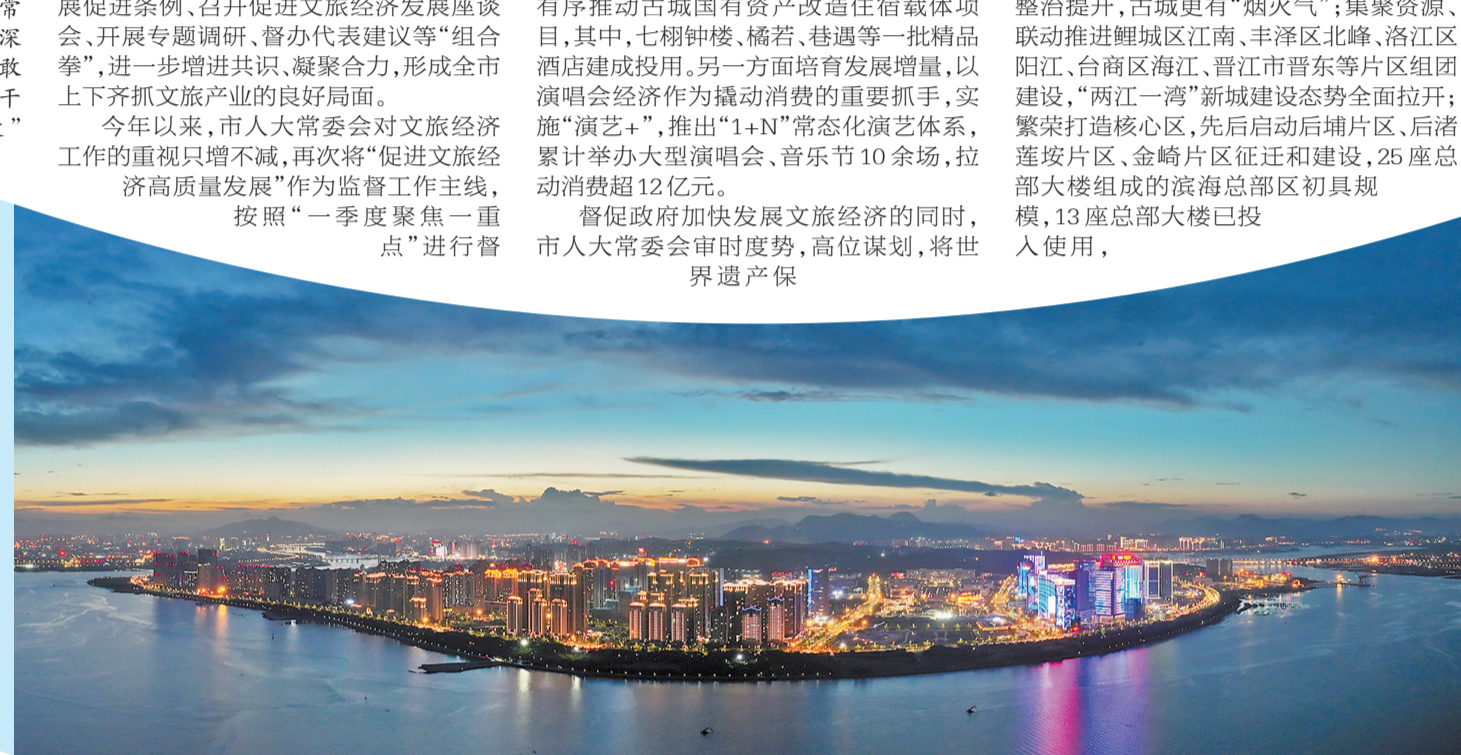
夜幕降临,华灯初上,放眼泉州“两江一湾”岸线,呈现烟火泉州的璀璨画卷。