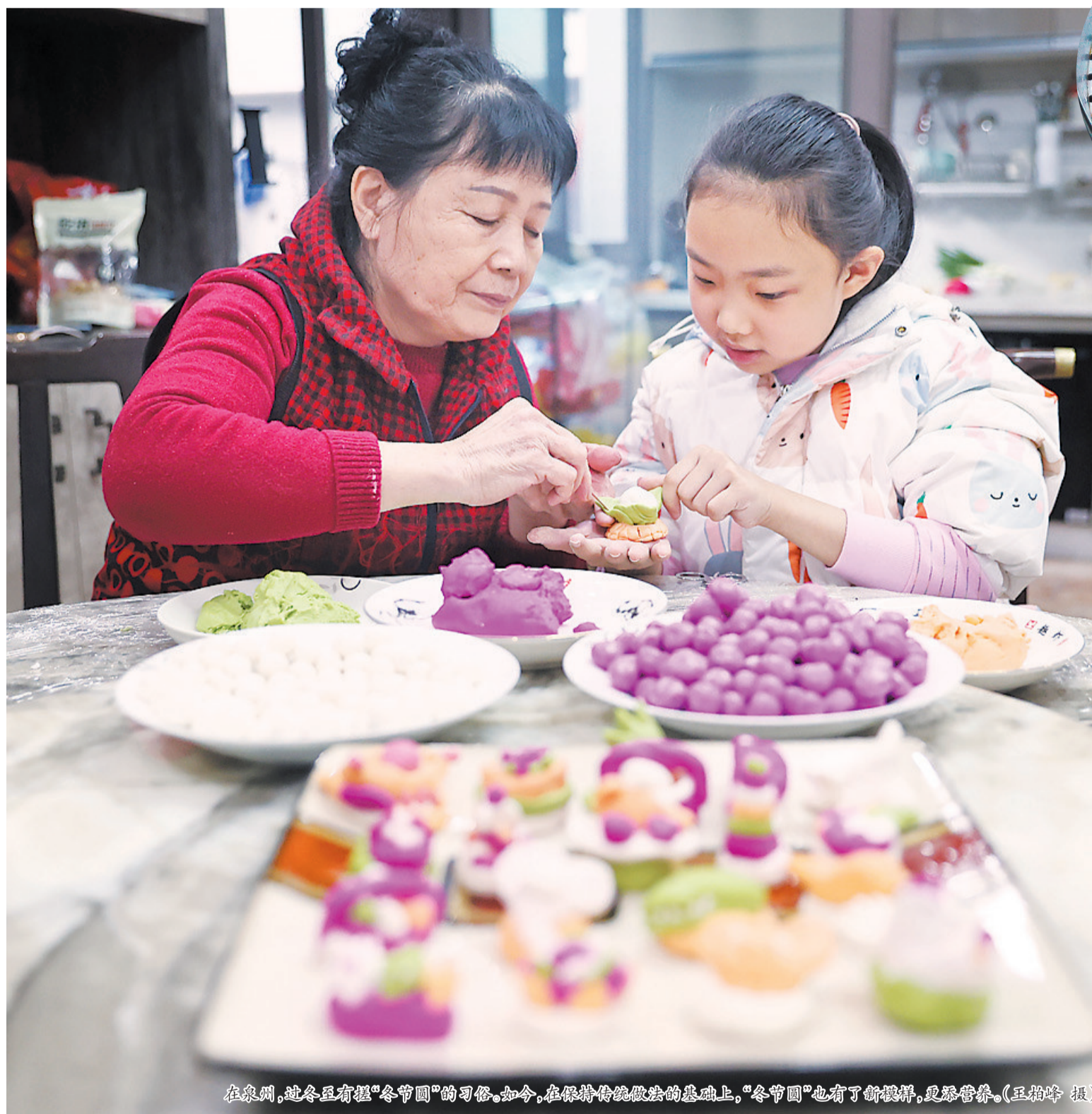
在泉州,过冬至有捏“冬节圆”的习俗。如今,在保持传统做法的基础上,“冬节圆”也有了新模样,更添营养。

带有浓郁闽南传统特色的民俗、食俗,鲜活地融入生活,并通过特色课程、趣味游戏、研学活动走入校园