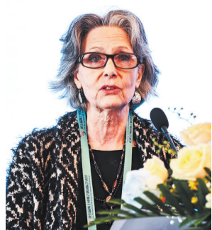
劳拉·巴巴里尼,意大利国际艺术联合会主席,近期来泉参加海上丝绸之路国际艺术发展研讨会。

古代丝绸之路见证了东西方文明的融合,各种艺术形式通过这条贸易之路流传开来。绘画、雕塑、陶瓷和其他艺术品通过丝绸之路传播,不仅为贸易带来了文化层面的影响,还促进了不同文明之间的艺术交流。