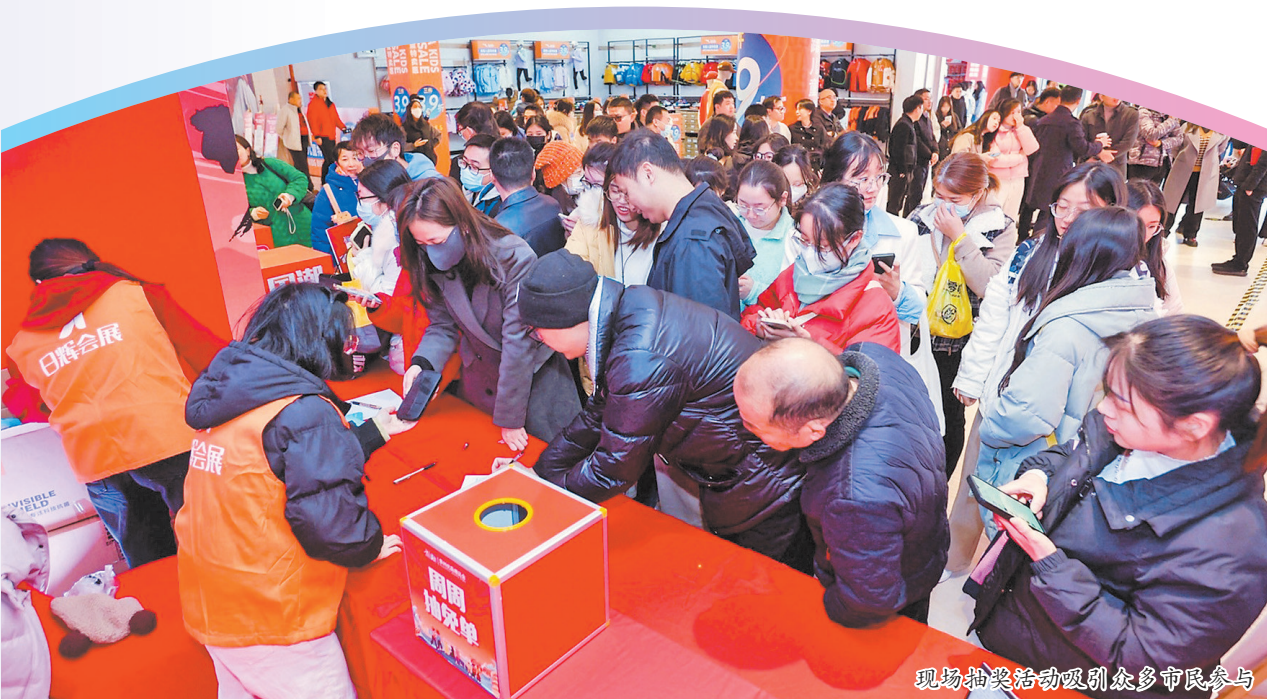
现场抽奖活动吸引众多市民参与