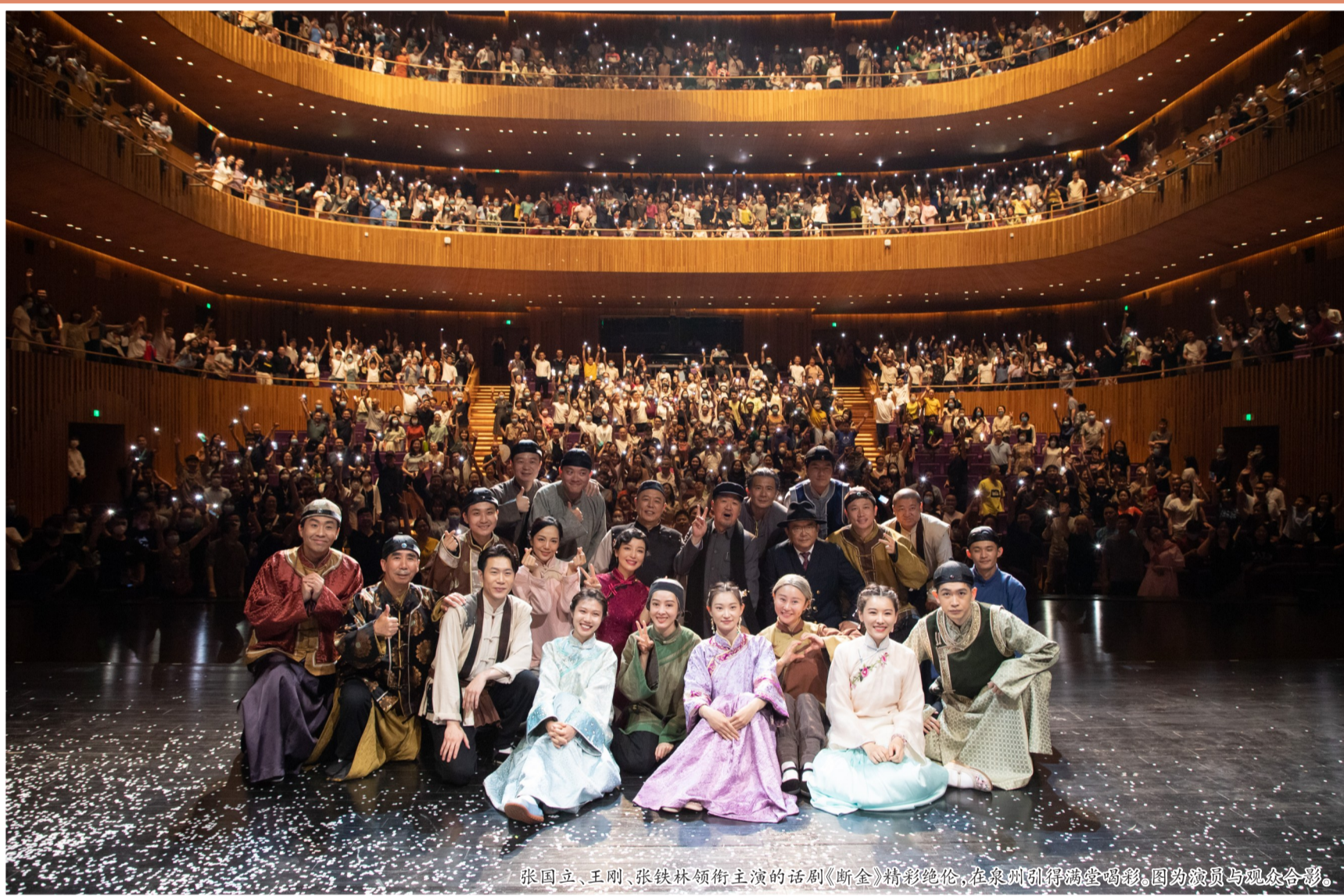
张国立、王刚、张铁林领衔主演的话剧《断金》精彩绝伦,在泉州引得满堂喝彩。图为演员与观众合影。