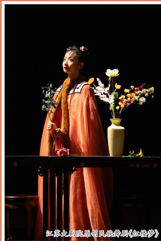
江苏大剧院原创民族舞剧《红楼梦》