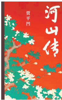
《河山传》 贾平凹 著 作家出版社

格就是多元化时代的产物。作者只是顺着时代的发展写出了这两个人物的结局,并没有主动站出来对他们进行褒贬和评判,而是将这一权力交给读者,也交给继续发展变化的时代,这种不写之写,也正是以志人手法书写时代风云的生动体现。