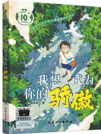
《我想成为你的骄傲》 陈伟军 著 人民卫生出版社

近些年,原生家庭这个词常被提起,有人说,在童年里受到的创伤,需要用一生去治愈。那如何让家庭真正成为青少年成长时最坚实的依靠和避风港?请把书名《我想成为你的骄傲》大声地喊出来吧,这是上半句,而把书名换一种表述,就是下半句,也大声喊出来:“孩子,你就是我的骄傲!”