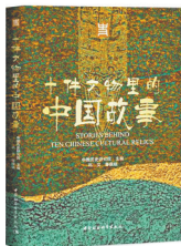
中国历史研究院 主编 中国社会科学出版社

该书遴选了十件代表性文物,通过专家学者们娓娓道来的叙述,以通俗易懂的语言,逐一呈现文物的发现、文物的内涵,以及文物所蕴含的中国理念、中国精神、中国价值。该书图文并茂,装帧精良,语言朴实,集专业性和普及性为一体,是广大读者走近文物,打开认识中国历史的一扇窗口。