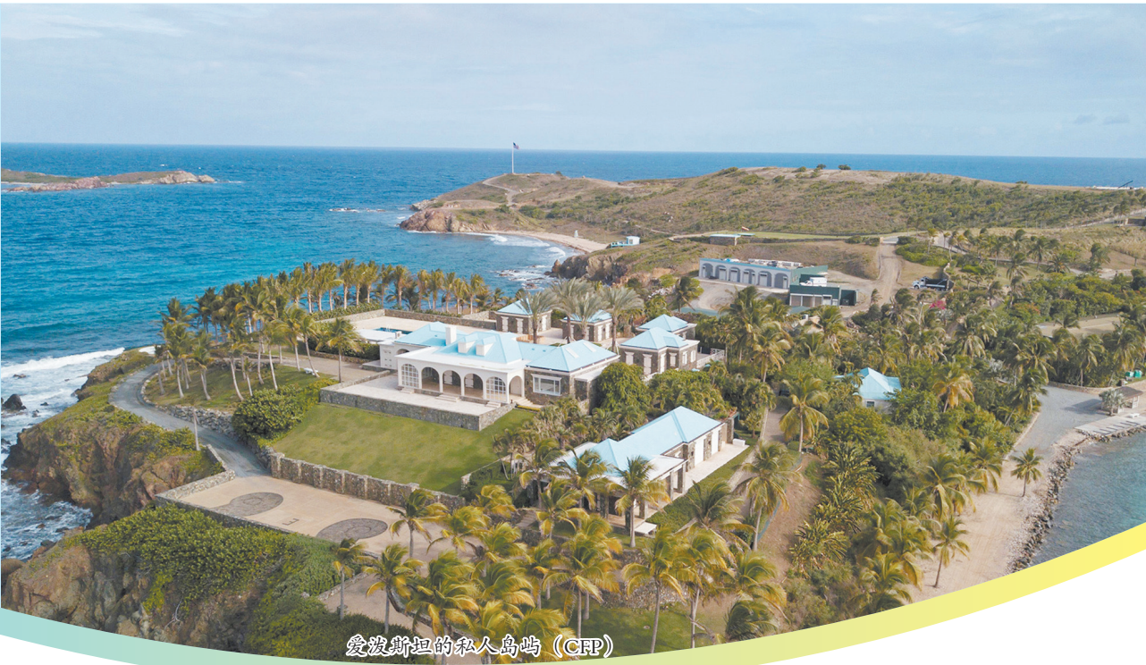
爱泼斯坦的私人岛屿

1月3日,在纽约地区法官普雷斯卡的命令下,200多份、数千页与爱泼斯坦案有关的法庭文件被陆续公开。之前一些曾经被涂黑的名字,现在已经被公开。包括美国前总统比尔·克林顿、英国安德鲁王子,甚至多年前有一位律师还提到迈克尔·杰克逊。