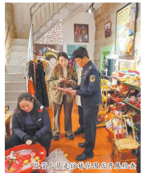
监管人员走访簪花围店开展检查

记者了解到,近期,我市将持续密集开展食品安全及价格监督检查,为广大消费者营造放心、安全的节日消费环境。