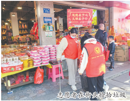
志愿者在街头捡拾垃圾

本报讯(融媒体记者张晓玲 文/图)昨日是大年初三,日暖风和,泉州古城街头人潮涌动,十分热闹。记者走访看到,在中心市区多个景区,不少市民、游客自觉遵守景区规定,主动维护公共环境,共同营造喜庆祥和的过节气氛。