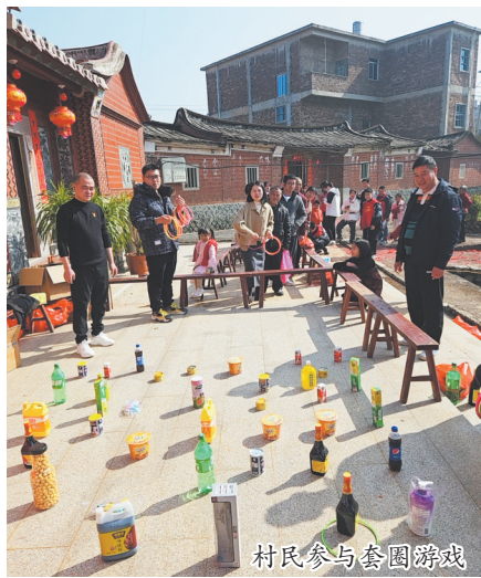
村民参与套圈游戏

本报讯(融媒体记者陈灵 杨泳红 文/图)新春佳节,南安金淘镇毓南村“党建+”邻里中心、新时代文明实践站在茂源湾潭祖祠、毓南村孝道文化馆举办“我们的节日·春节”新春文体活动,村民、乡贤欢聚知年俗、品年味、享年趣。