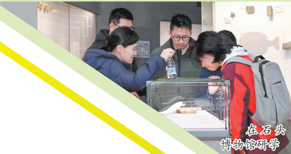
在石头博物馆研学

泉港的山腰盐场历史悠久,这里保留了许多与盐业相关的文化遗产,吸引了不少游客。在海盐产业创新研发的文创产品展示厅,受游客青睐的还有药盐雕、盐灯孔、海盐日化手工皂等系列产品创新产品。