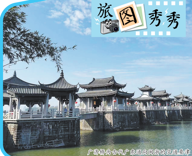
广济桥为古代广东通向闽浙的交通要津