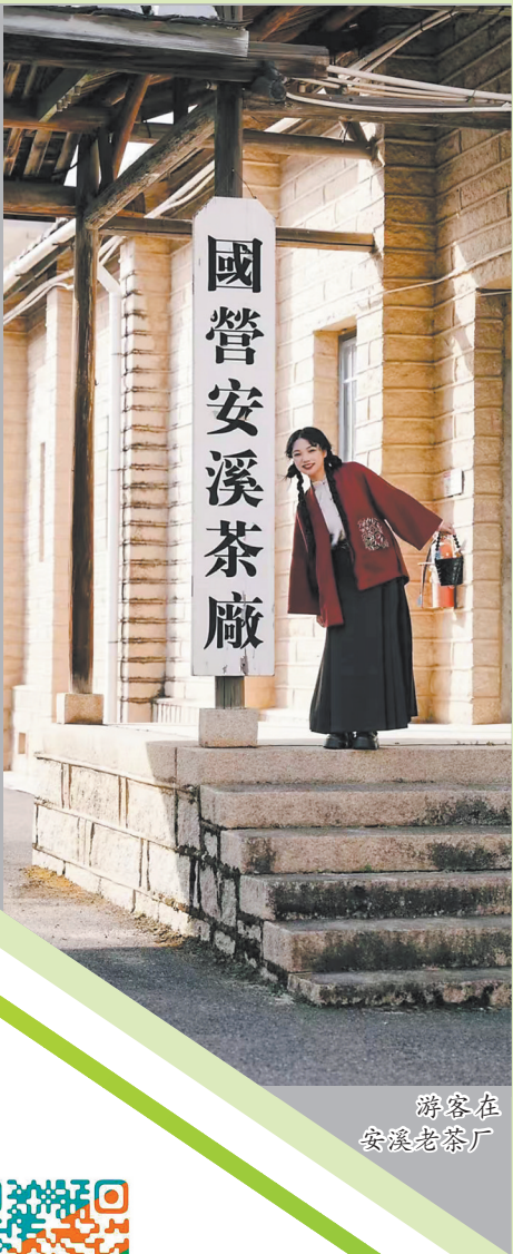
游客在安溪老茶厂