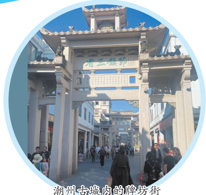
潮州古城内的牌坊街