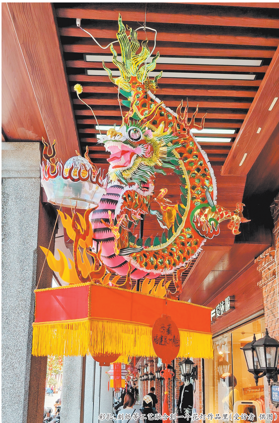
彩扎、刻纸等工艺融合到一个花灯作品里(受访者 供图)