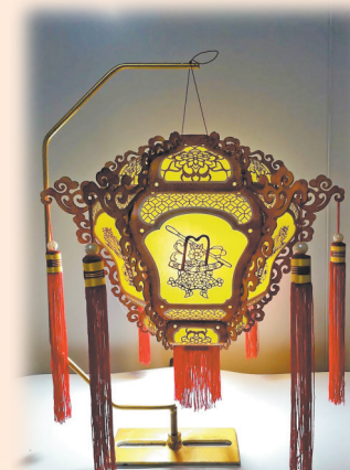
刻纸灯《葫芦八宝》(受访者 供图)