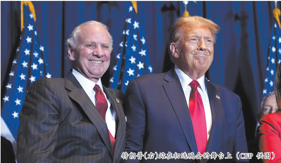
特朗普(右)站在初选晚会的舞台上