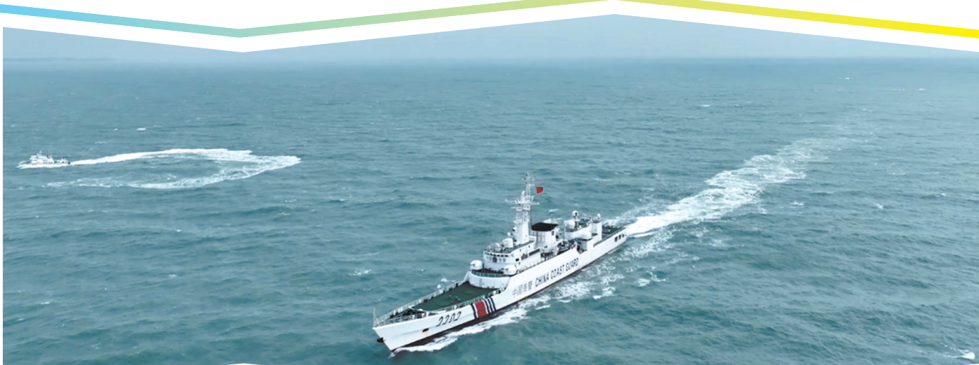
福建海警舰艇与台艇(左侧小艇)“同框”

农业农村部新闻办公室25日傍晚发布的新闻稿表示:“当前正值渔业生产旺季,福建省渔业渔政部门将根据需要进一步加强海上执法力量,开展常态化渔业巡航执法行动,保障渔民合法权益和生命财产安全。”(央视 中新)