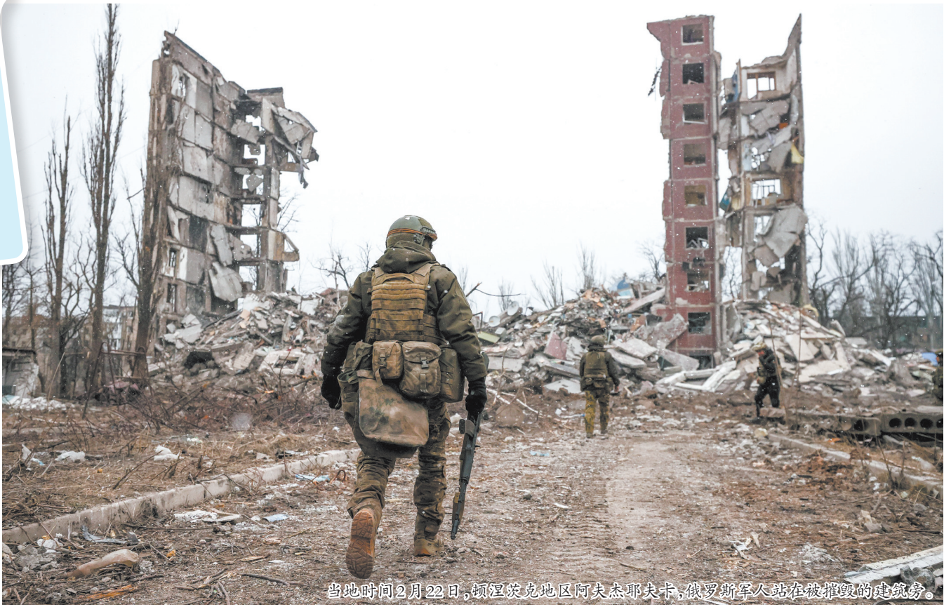
当地时间2月22日,顿涅茨克地区阿夫杰耶夫卡,俄罗斯军人在被摧毁的建筑旁。