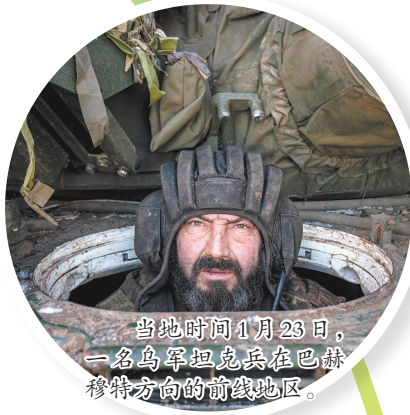
当地时间1月23日,一名乌军坦克兵在巴赫穆特方向的前线地区。