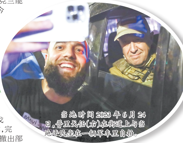
当地时间2023年6月24日,普里戈任(右)在街道上与当地平民坐在一辆军车里自拍。

2023年12月19日,俄防长绍伊古表示,自俄方军事行动开始,乌军共有超38.3万名士兵伤亡,仅2023年6月,乌军开启反攻以来,乌方就已损失15.9万名军事人员。乌克兰国防部更新的俄军损失数据则显示,至2024年2月20日,俄