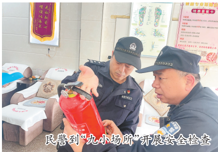
民警到“九小场所”开展安全检查

同时,民警还向各场所负责人进行消防安全知识宣传,要求“九小场所”负责人严格落实“人防、物防、技防”各项安防措施,定期开展内部自查自纠工作,不断增强从业人员责任意识和安全防范意识,切实把安全隐患消灭在萌芽状态,防止火灾事故的发生。