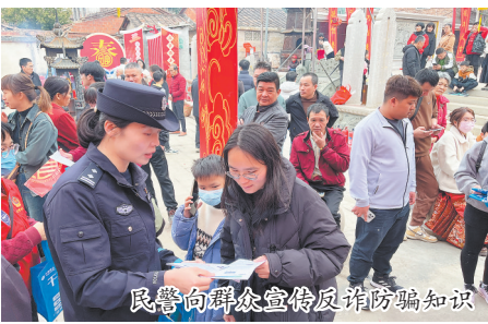
民警向群众宣传反诈防骗知识

元宵节以来,市区各街区尤其是布置花灯、景观的展区,人流量大。丰泽公安分局治安大队民警带领“一带百”社区警务团队开展“元宵反诈守平安”反诈宣传活动,发放宣传资料,用通俗易懂的语言向群众详细介绍电信网络诈骗、养老诈骗的类别和防范方式,引导群众下载、注册“国家反诈中心”APP,把反诈知识寓于赏花灯等节庆活动,在传承中华民族文化习俗的同时,让市民在轻松活泼的氛围中学到反诈知识。