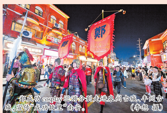
郭成功cosplay巡游队分别走进泉州古城、丰州古城,宣传“成功故里”南安。