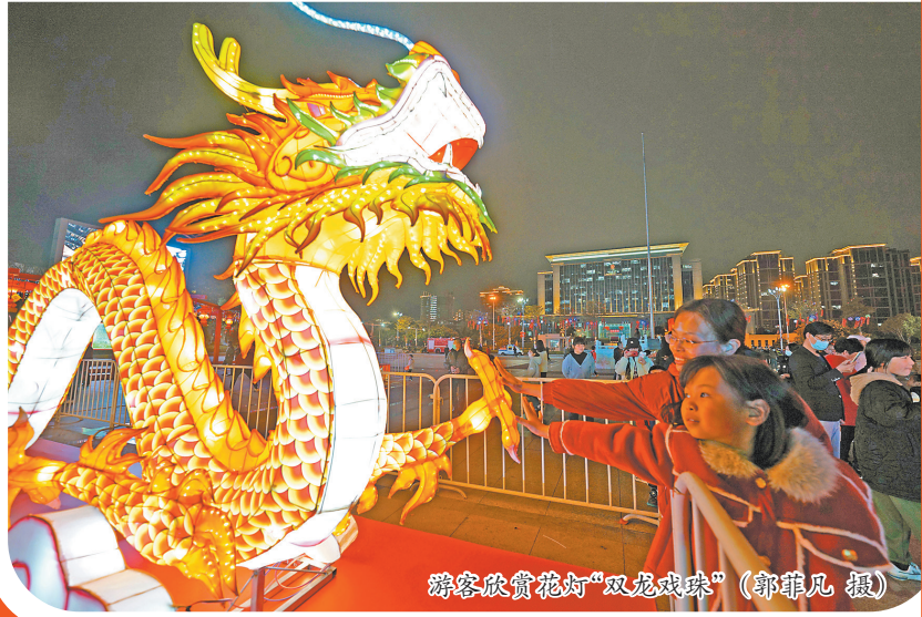
游客欣赏花灯“双龙戏珠”