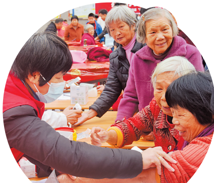
志愿者协会在柳城街道新时代文明实践所广场为村内老人进行义诊