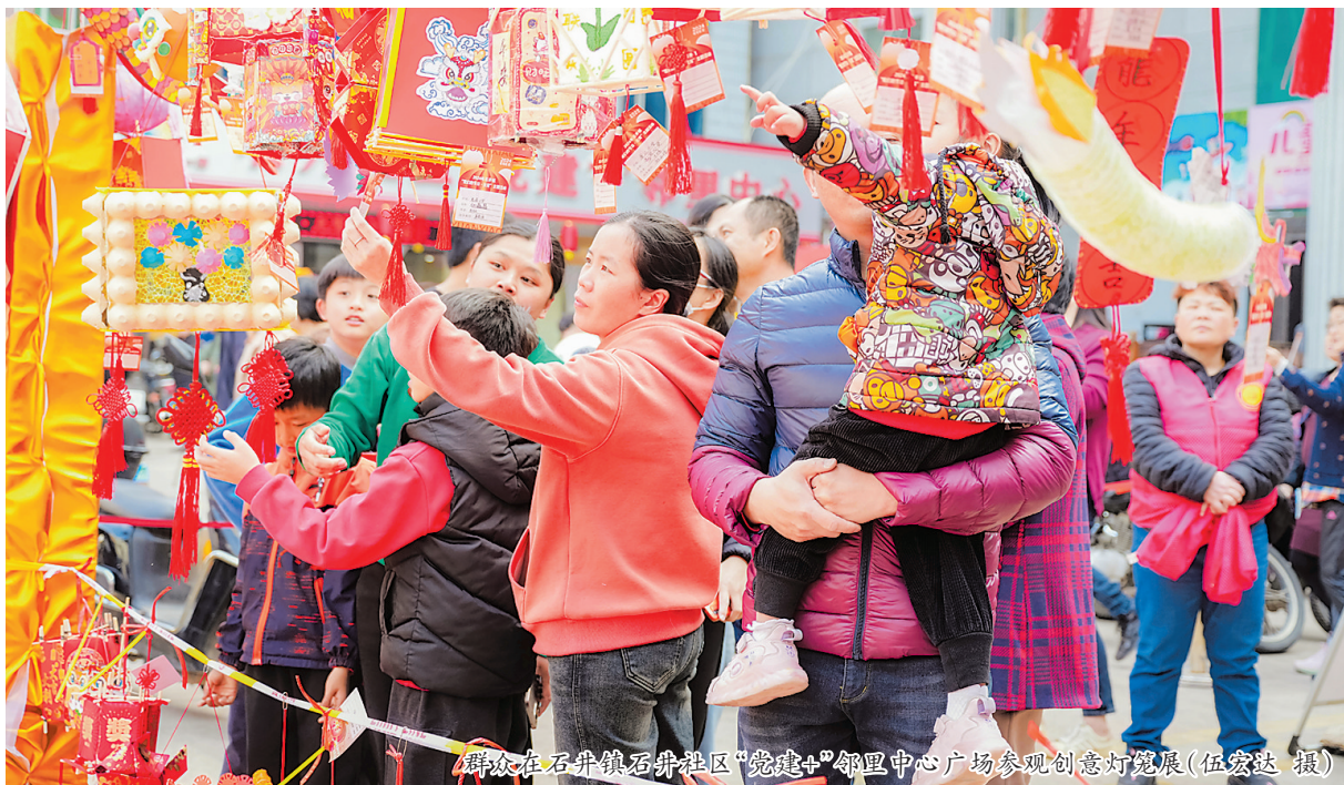
群众在石井镇石井社区“党建+邻里中心”广场参观创意灯展