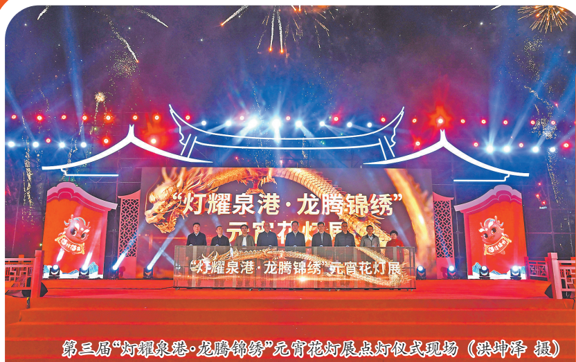
第三届“灯耀泉港·龙腾锦绣”元宵花灯展点灯仪式现场

神龙过境展千灯,康养福地飞腾远。2月24日正月十五,传承600多年的游板凳龙灯闹元宵民