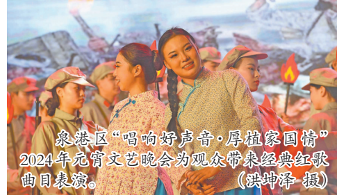
泉港区“唱响好声音·厚植家国情怀”2024年元宵文艺晚会为观众带来经典红歌曲目表演。