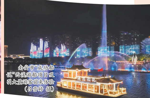
南安市“成功船说”西溪游船项目吸引大量游客前来体验