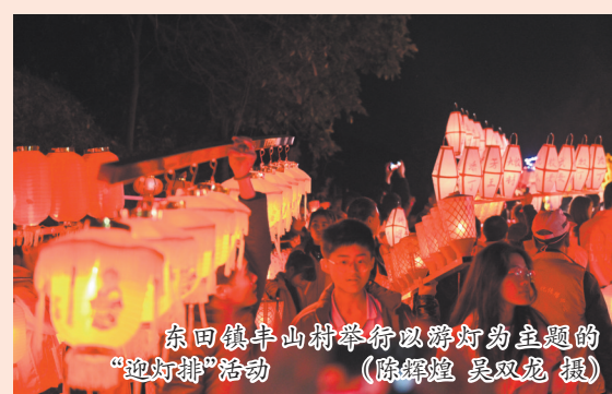
东田镇丰山村举行以灯笼为主题的“迎灯排”活动