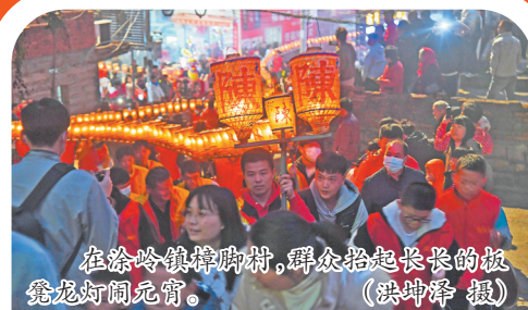
在涂岭镇樟脚村,群众抬起长长的板凳龙灯闹元宵。