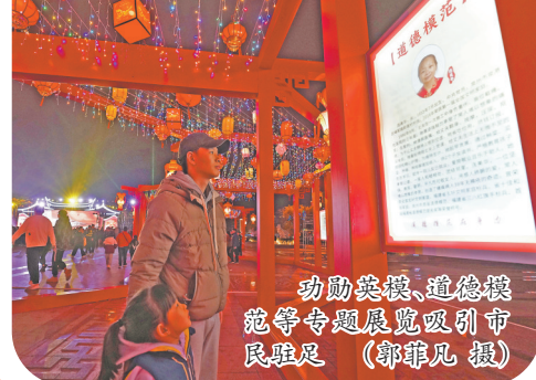
功勋劳模、道德模范等专题展览吸引市民驻足

俗活动,在涂岭镇樟脚村如期而至。由13段组成、全长约400米的板凳龙灯犹如一条“火龙”在乡间间道通行。龙身蜿蜒,流光溢彩,所到之处鞭炮连天、锣鼓喧鸣,龙灯队全村游走,最后回到各村小组祖厝进行“跳火堆”祈福,场面蔚为壮观。作为泉港非物质文化遗产,板凳龙灯寄托了泉港百姓祈求来年平安健康添丁添财的美好愿望。