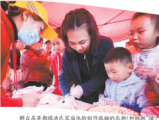
群众在英都镇洪氏家庙体验制作麻糍的乐趣