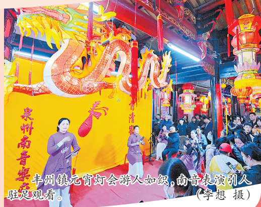
丰州镇元宵灯会游人如织,南音表演引人驻足观看。