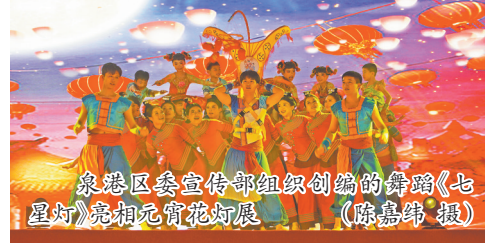
泉港区委宣传部组织创编的舞蹈《七星灯》亮相元宵花灯展