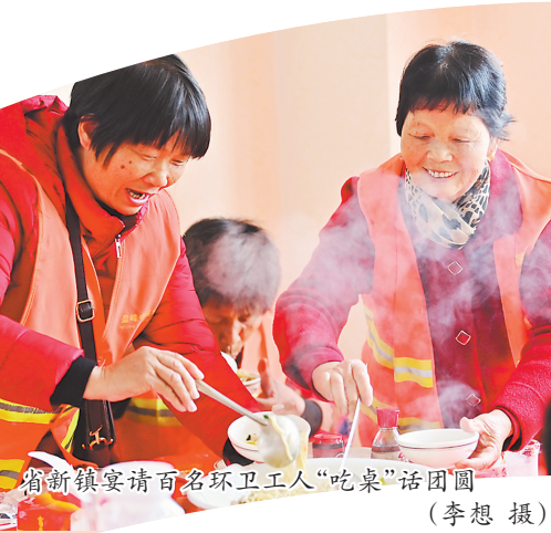
省新镇宴请百名环卫工人“吃桌”话团圆

南安还持续开展招商引资、公益慈善,掀起干事创业的热潮,开展“3+10”新春系列招商活动,通过“现场考察+集中签约”实地推介、招商恳谈会及“招商+”等专场活动吸引企业家们投资兴业。与此同时,社会各界情系桑梓,回报家乡,积极为医疗、教育、基础设施等领域慈善捐款,助力公益事业发展。截至目前,该市共开展超30场新春招商座谈会、19场次集中签约大会,吸引186个项目参加签约,总投资额达690亿元;举办公益慈善活动近100场,认捐善款超1亿元。(林婧 陈鑫伟 尤朝英)