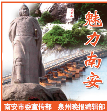
魅力南安 南安市委宣传部 泉州晚报编辑部