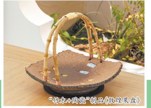
“竹木+陶瓷”制品《敦煌果盘》

距离竹溪里约10米分秒车程便是德化县4A级景区石牛山，境内有毛竹林上千亩，绵延数百平方公里，乘坐缆车，放