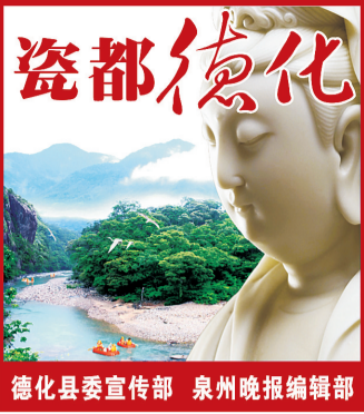
德化县委宣传部 泉州晚报编辑部