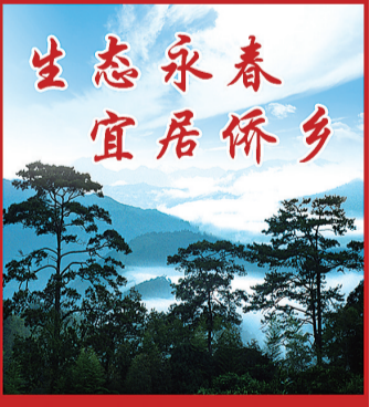
永春县委宣传部 泉州晚报编辑部

思想的“闸门”一打开，干部的精气神再凝聚，新思路、新理念必定充分涌流，新举措、新办法一定层出不穷，新活力、新动能必将充分迸发，星光不问赶路人，时光不负奋斗者，荣光属于实干家。在新的一年里，要增强发展意识、机遇意识、竞争意识，使劲跳起来摘桃子，以更高的思想之新引领发展之新，以更深的观念之变带动工作之变。(永春县委办)