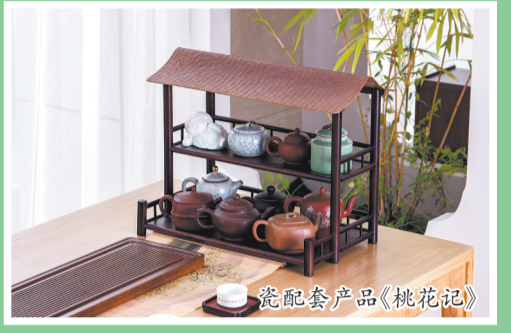
瓷配套产品《桃花记》