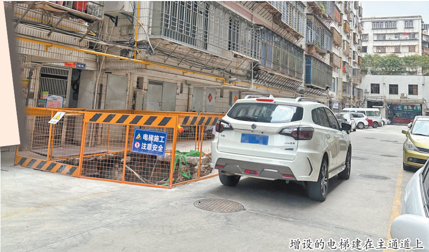
增设的电梯建在主通道上