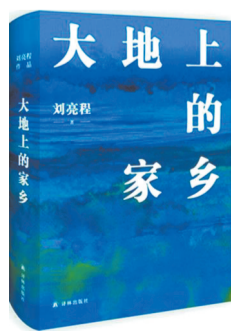
刘亮程著 译林出版社

本书为第十一届茅盾文学奖得主刘亮程最新作品,是其散文经典《一个人的村庄》时隔多年的回归之作。菜籽沟村堆满故事:鸡鸣中醒来日出而作,看树上开会的乌鸦;想象开满窗户的山坡,关心粮食和收成,在一棵大树下慢慢变老。这些被人视若寻常的故事,都是他的生活大事。世界也是一个更大的菜籽沟村。心安即是归处,花开花落,死生忙碌,我们最终都会活成自己的家乡。