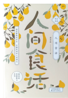
《人间食话》梁实秋著 天津人民出版社