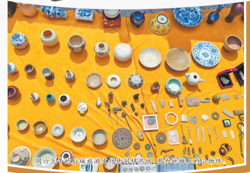
周六上午的后城旅游文化街同样热闹,图为地摊上的小物件。