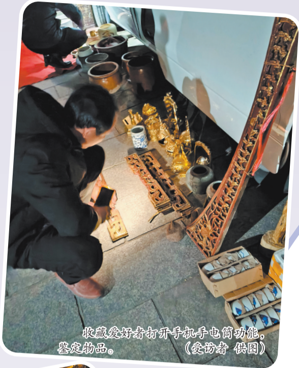
收藏爱好者打开手机手电筒功能,鉴定物品。