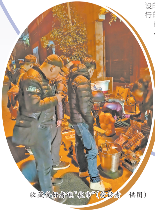
收藏爱好者逛“夜市”