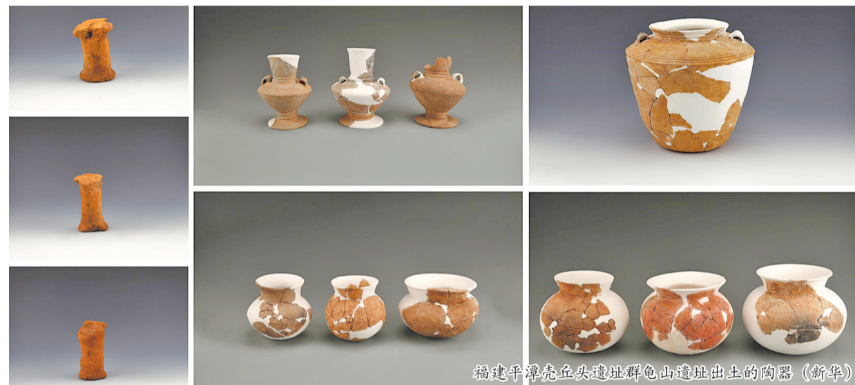
福建平潭壳丘头遗址群龟山遗址出土的陶器

据介绍,2023年度全国十大考古新发现经项目汇报会、综合评议,最终由评委投票选出。终评会评委通过抽签方式从评审委员会专家库中随机抽取产生,21位评委分别来自中国社会科学院考古研究所、中国科学院古脊椎动物与古人类研究所、北京大学等单位。