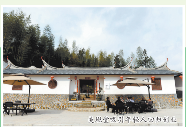
美垵堂吸引年轻人回归创业

为进一步强化闲置土地的活化利用,丁垵村成立凤翥白瓷古镇文旅有限公司,作为村财增收平台,统一流转200多亩土地及部分民房,用于研学基地建设、蔬菜种植,形成农业连片规模开发效益。此外,龙浔镇先后投入2500多万元完成人居环境及道路提升改造,推进旅游基础设施建设,打造山湖脚瀑布群、农耕文化等项目,推动厦大研学基地落地。