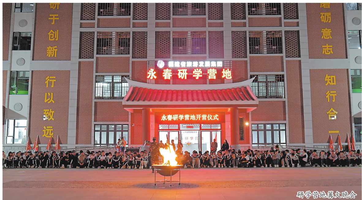
研学营地篝火晚会