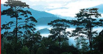
永春县委宣传部 泉州晚报编辑部