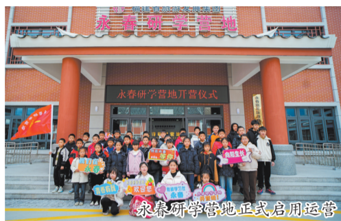
永春研学营地正式启用运营