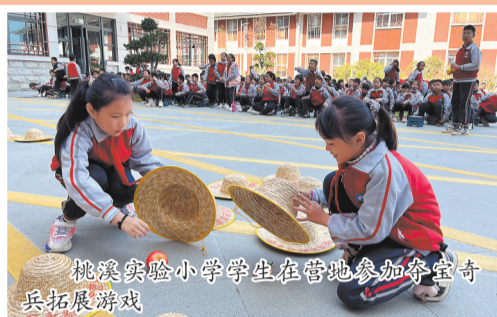
桃源实验小学学生在营地参加寻宝奇兵拓展游戏

本报讯 近日,坐落于永春县旅游集散中心后方的永春研学营地正式启用,并迎来首批800多名学生参加研学活动。