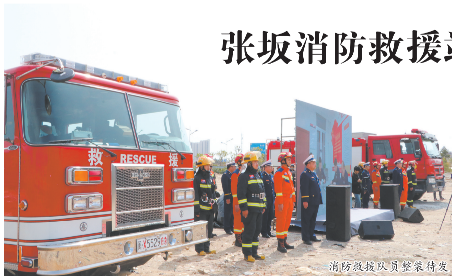
消防救援队员整装待发

本报讯(融媒体记者罗剑生 通讯员陈水秀 文/图)近日,泉州台商投资区举行“规划引领 强基固本”张坂消防救援站奠基仪式。