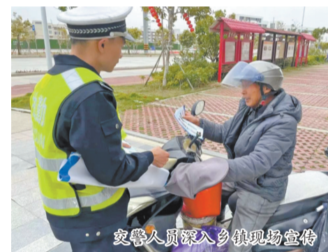
交警人员深入乡镇现场宣传

本报讯(融媒体记者张文璟 通讯员张恩拔 文/图)日前,泉州台商投资区交警部门深入辖区乡镇,开展“美丽乡村行”交通安全宣传活动,筑牢群众安全防线。