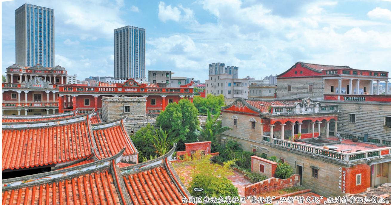
台商区盘活龙岩社区“番仔楼”,弘扬“侨文化”,吸引侨亲回归创业。