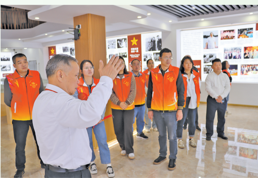
3月27日是归国华侨将军陈青山逝世21周年纪念日。日前,泉州台商投资区公交公司党员志愿者、洛阳镇陈埭头村党员干部及群众一行来到位于洛阳镇的陈青山将军纪念馆,开展主题党日活动。义务讲解员陈清雄向大家讲述了陈青山将军的英雄事迹,将红色记忆深深植入每一位参观者的心间。大家还对陈青山将军雕像献上花圈,寄托对将军的哀思。

乡镇还安排志愿者到祭扫场所对居民群众进行监督与提醒,及时制止不文明、不规范的祭祀行为,营造深化移风易俗、破除陈规陋习的浓厚氛围。志愿者还前往骨灰堂、追思堂等地开展环境卫生清洁活动,对室内室外、卫生死角、楼道内的垃圾进行清理和分类,并结合垃圾分类宣传手册向附近居民讲解垃圾分类知识,引导做好垃圾分类,规范垃圾处理。