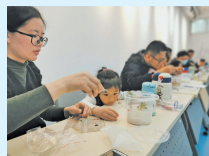
日前,泉州台商投资区文化服务中心开展主题“亲子读书绘”活动,带领小朋友阅读绘本并了解水资源等相关知识。图为小朋友在家长引导下现场制作包含泥沙、清水、水草、小鱼的手工生态瓶,在亲子互动中进一步认识大自然,增强环保意识。

火应急预案的科学性、实用性与可操作性。下一步,台商区将立足实际情况,配备保障设施,加强宣传教育,不断强化应急救援队伍的协同作战能力,全面提升火灾防控能力和水平,筑牢森林“防火墙”。