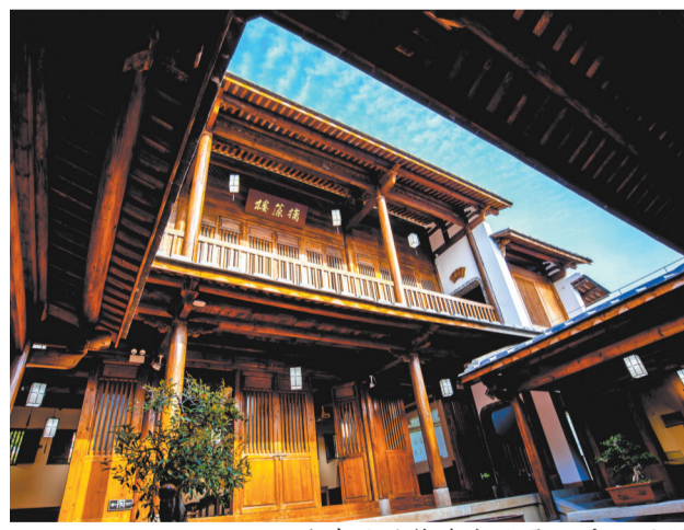
重建后的梅峰书院是一座二层闽南风格传统砖木结构四合院