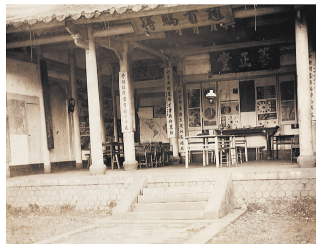
清末老照片里的梅峰书院(资料图)