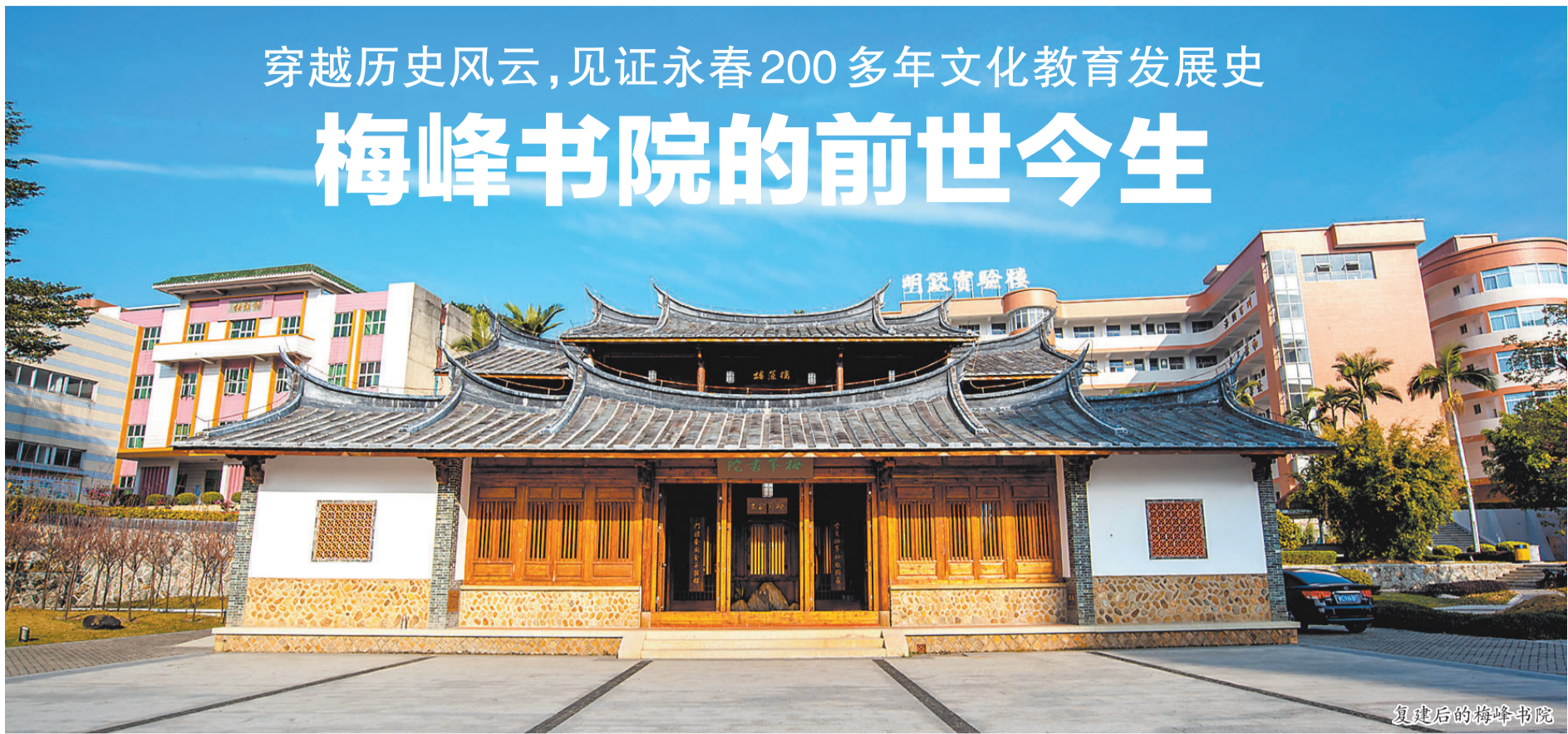
重建后的梅峰书院

梅峰书院,地处永春县五里街镇华岩社区梅峰之麓,是清代永春直隶州设立的官方书院,也是永春第一中学的前身。它始建于清乾隆三十一年(1766年),是永春文化教育史的重要见证。