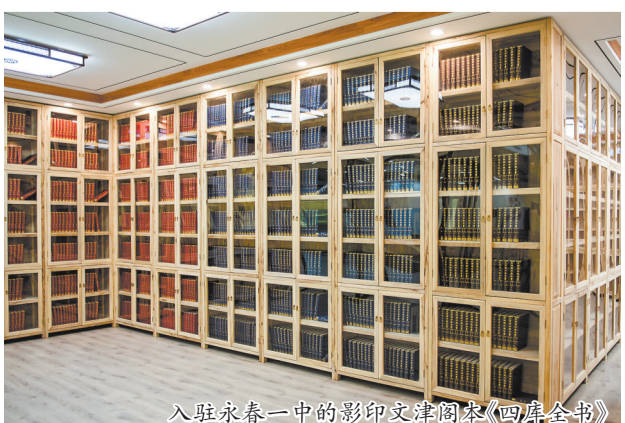
入驻永春一中的影印文津阁本《四库全书》