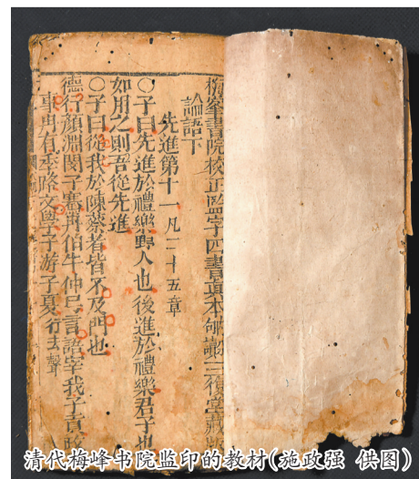
清代梅峰书院监印的教材

据1990年新编《永春县志》文物志记载,在永春一中校园内原有梅峰书院碑刻四方,现在仅存二方。存碑一为提督福建学政王杰撰写的《梅峰书院记》,一为《永春州梅峰书院碑记》(刊刻捐资人姓名和捐银数目),时间均为梅峰书院建成后的第二年即乾隆三十二年(1767年)。王杰之碑尚清晰可辨,捐资碑则因风化严重而湮没难识。另外二碑,一为知州嘉谟撰写的《梅峰书院记》(其文字在清乾隆五十二年版《永春州志》和民国版《永春县志》中有收录),一为道光四年(1824年)所立的《梅峰书院碑记》(由于史料缺失,其具体内容已不可考)。