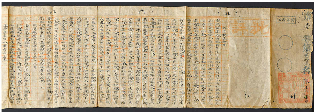
清代梅峰书院批改的学生八股文课业(施政强 供图)