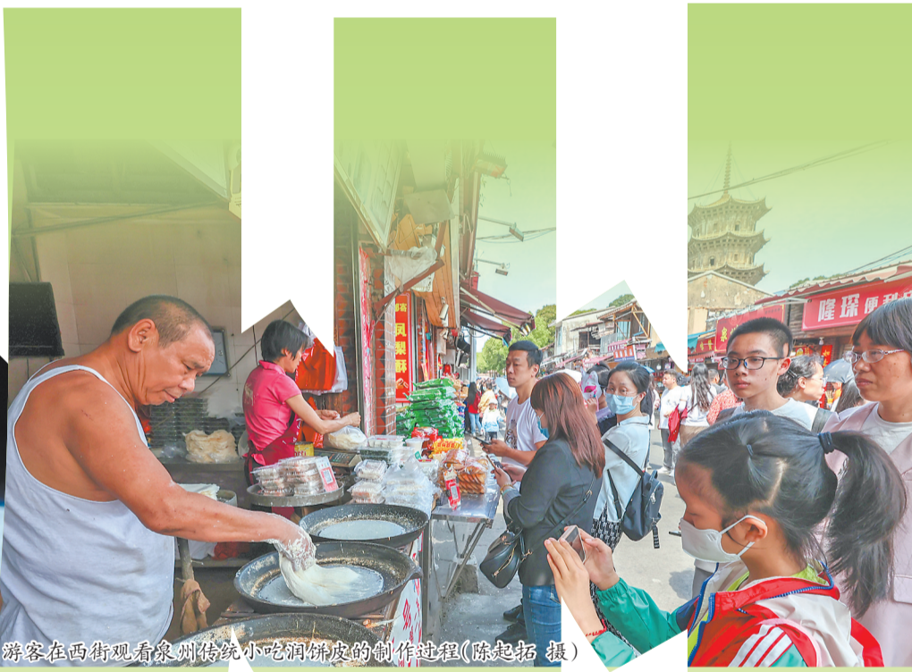
游客在西街观看泉州传统小吃润饼菜的制作过程