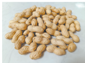
常吃花生可养肝补脾

2024年3月18日是第24个“全国爱肝日”。春季气温回暖，万物复苏，春风渐起，阳气生发，呈现一片生机勃勃之象。因此，春季养肝可以顺应自然，达到保健的目的。从中医的角度出发，可以用合适的中药材或是食材来调理。