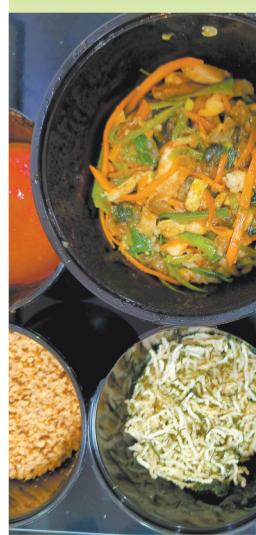
海苔、花生碎、胡萝卜等是包润饼菜的主馅料