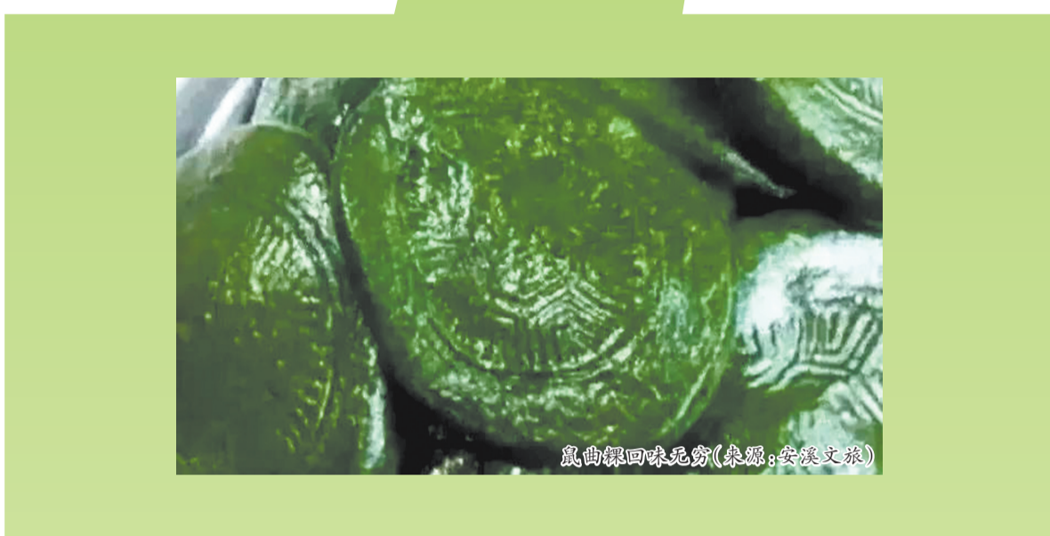
鼠曲粿回味无穷

鼠曲粿以咸的馅料居多，常有干萝卜丝、香菇丁、肉丁、虾米、笋干等。馅料炒好后，捏一团和好的粉团，将馅料均匀地包进去。然后用竹叶裹住包好馅的鼠曲粿，放入蒸笼中蒸煮半个小时，趁热品尝，回味无穷。