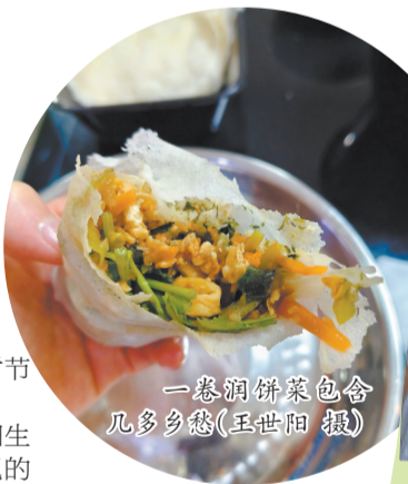
一卷润饼菜包含几多乡情

随后依次撒上花生碎，以及由三层肉、胡萝卜等焯煮成的主馅料，最后点缀一些蒜白和香菜，卷成圆筒状，双手握好，一卷美味的润饼菜就成了。还可根据个人的口味添加一些蘸料，例如芥辣、辣酱、甜酱等。手握一卷润饼菜，轻轻咬下一口，弹牙又略带咸味的饼皮被咬开，首先迎接味蕾的是海苔的香气，还没享受完香脆的米粉海苔末，主馅料错综复杂的味道也“紧随其后”，一下子，脆的、甜的、咸的、滑的、酥的，丰富滋味溢满口腔，让人一下胃口大开，欲罢不能。