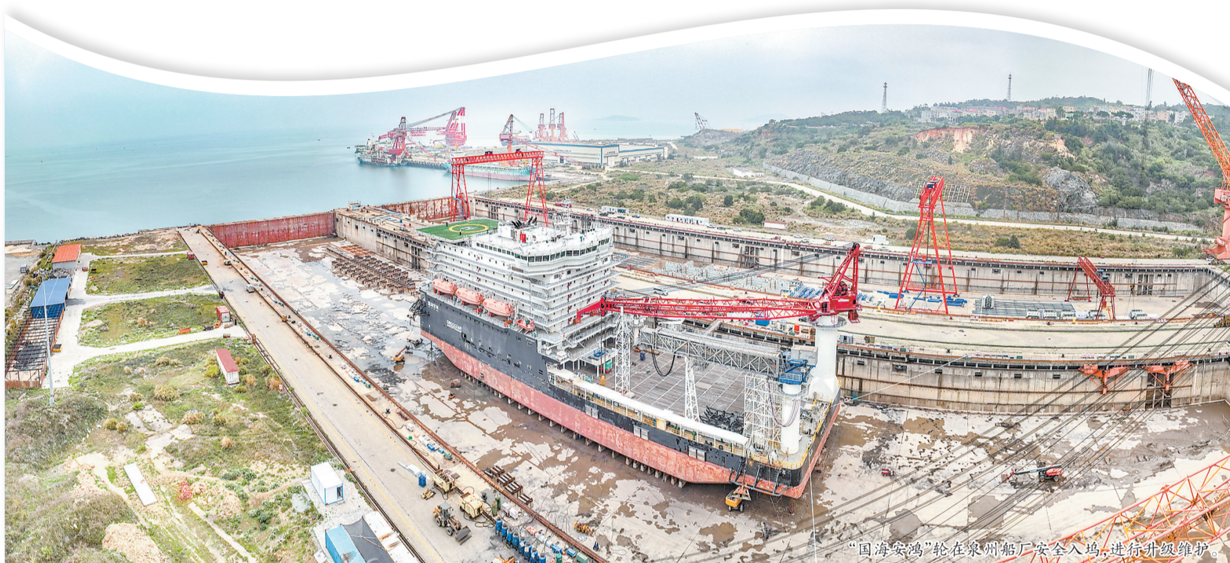
“国海安鸿”轮在泉州船厂安全入坞,进行升级维护。