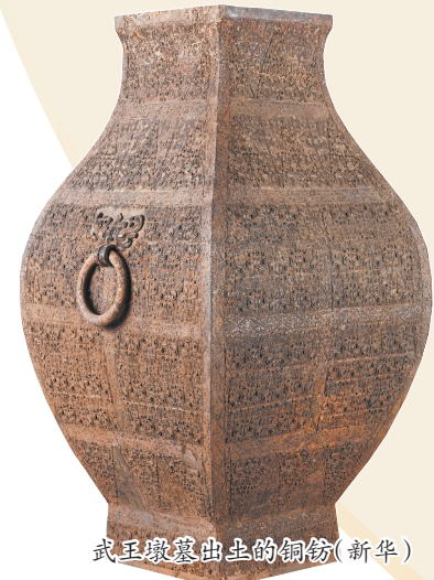
武王墩墓出土的铜仿

战国,金戈铁马的时代,群雄争霸,朝秦暮楚。 雄据一方的楚国,是战国七雄之一,据传几度迁都。楚人的生活情况什么样?楚王的故事真假几何?这些问题至今引人遐想。 在4月16日举行的“考古中国”重大项目重要进展工作会上,国家文物局发布了考古发掘的迄今楚国最高等级墓葬——安徽省淮南市武王墩墓的最新发现,楚国历史的封土正被层层揭开。 □新华 央视