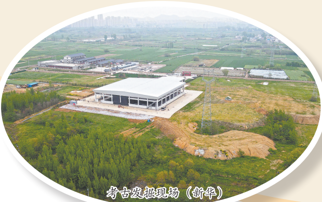
考古发掘现场(新华)