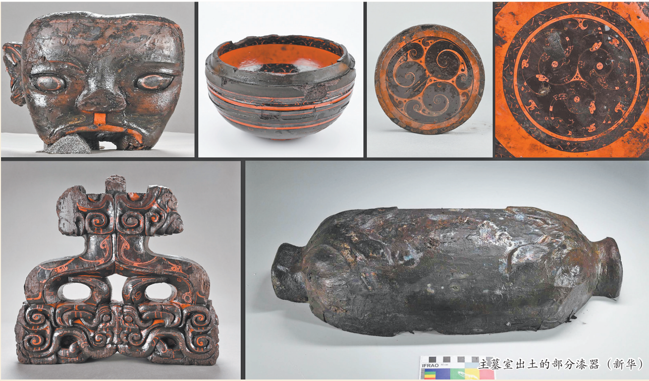
主墓室出土的部分漆器

武王墩主墓(一号墓)为一座大型“甲字形”竖穴土坑墓。封土堆整体呈覆斗状,总面积约1.2万平方米。墓坑近正方形,边长约50米,墓坑东侧有长约42米的斜坡墓道。在目前发掘的楚墓中也是最大的。