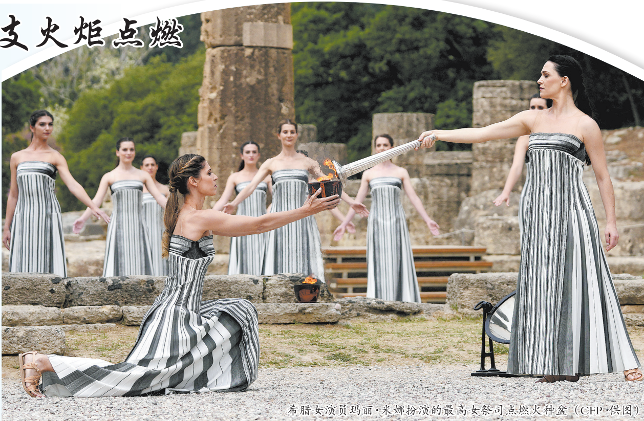
希腊女演员玛丽·米娜扮演的最高女祭司点燃火种盆

2024年巴黎奥运会将于7月26日开幕,8月11日闭幕,部分项目的比赛将于7月24日率先开赛。(人日)