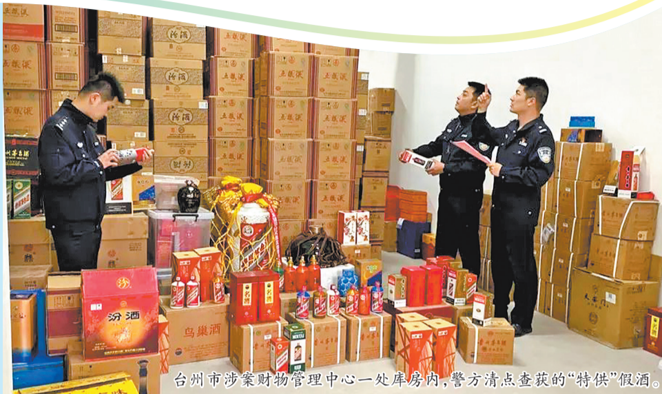
台州市涉案财物管理中心一处库房内,警方清点查获的“特供”假酒。

“特殊渠道”是否真的存在?“特供”酒里“套路”有多深?“特供”酒缘何存在市场?记者进行了调查。 □新华文/图