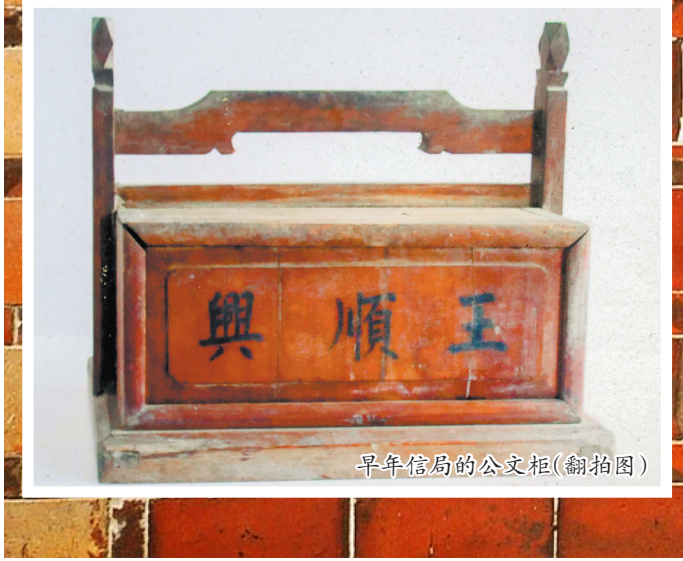
早年信局的公文柜(翻拍照)