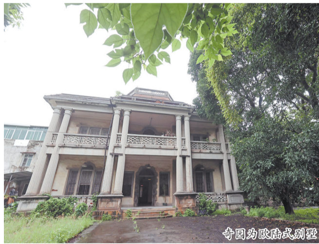
奇园为欧陆式别墅