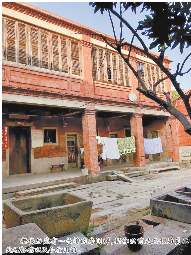
船楼后座有一长排的房间群,据称以前是给信局员工处理银信以及住宿用的。