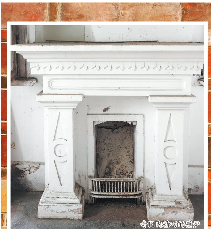
奇园内精巧的壁炉