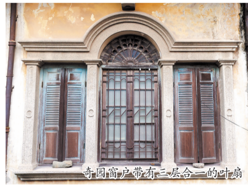
奇园窗户带有三层合一的叶扇