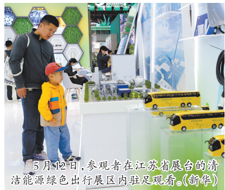
5月12日,参观者在江苏省展台的清洁能源绿色出行展区驻足观看。

中国人民银行的报告显示,下阶段,中国人民银行将发挥好政策合力,有效调动经营主体的资金运用,更好实现居民消费、企业愿投资、政府能兜底,推动实体经济畅通循环。