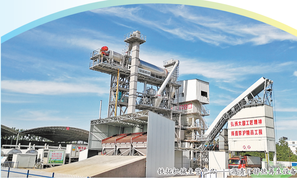
铁拓机械主营产品——沥青厂热再生设备