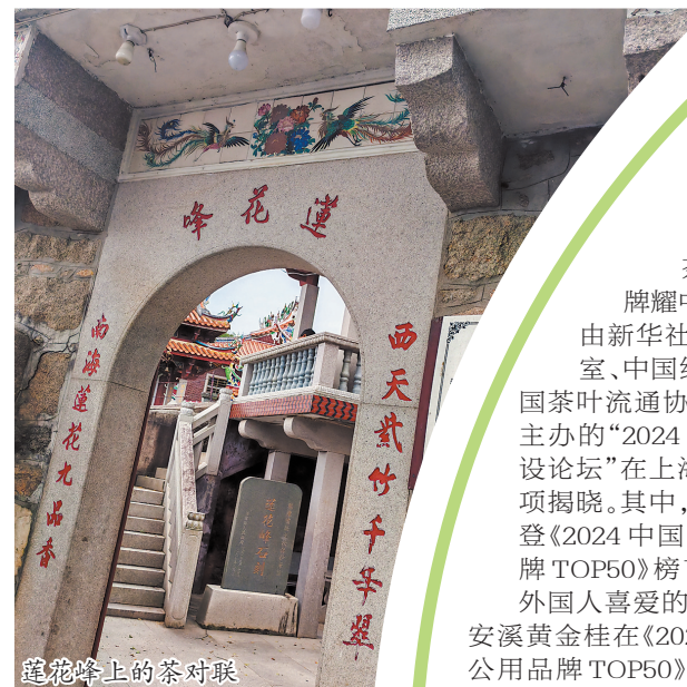
莲花峰上的茶对联