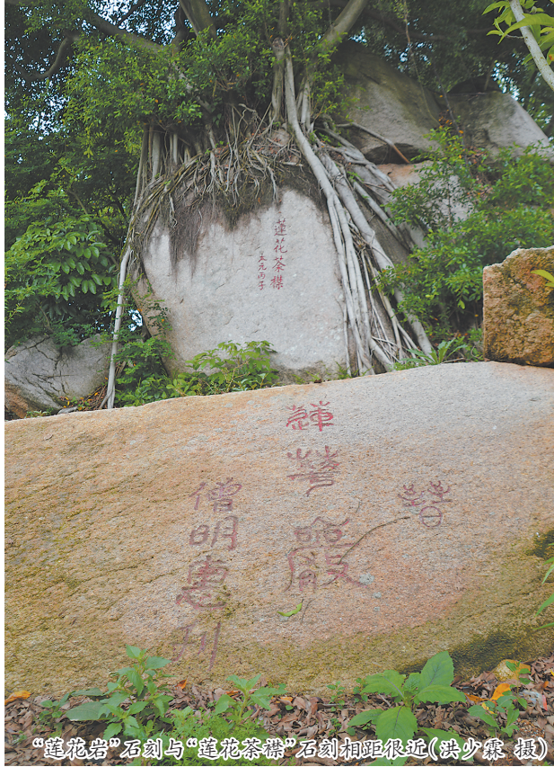
“莲花岩”石刻与“莲花茶襟”石刻相距很近