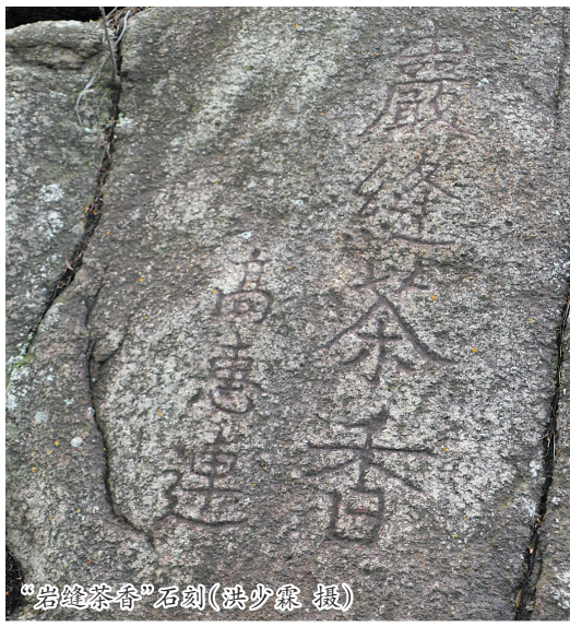
“巖縫茶香”石刻