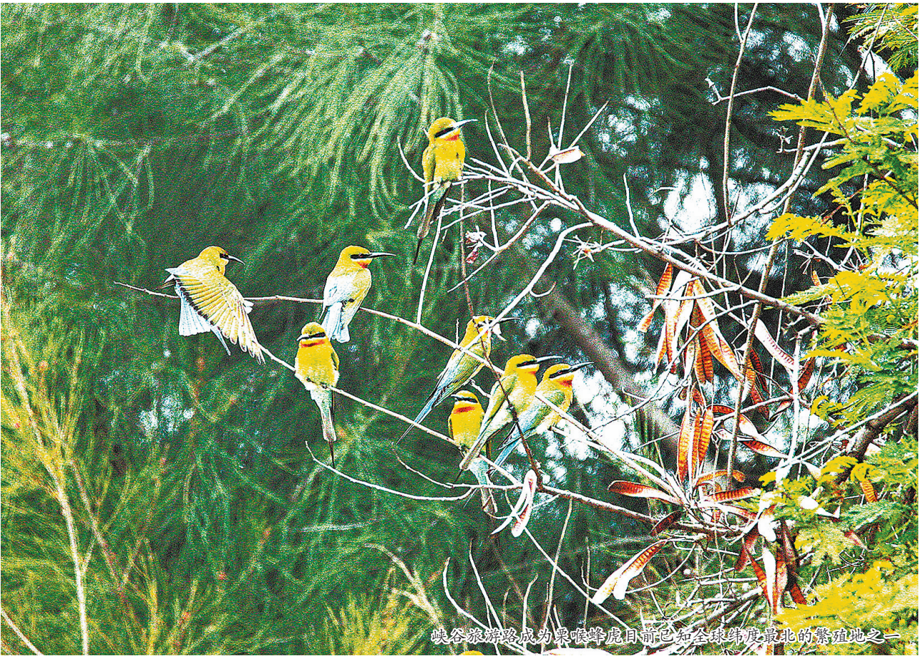
峡谷旅游路成为栗喉蜂虎目前已知全球纬度最北的繁殖地之一