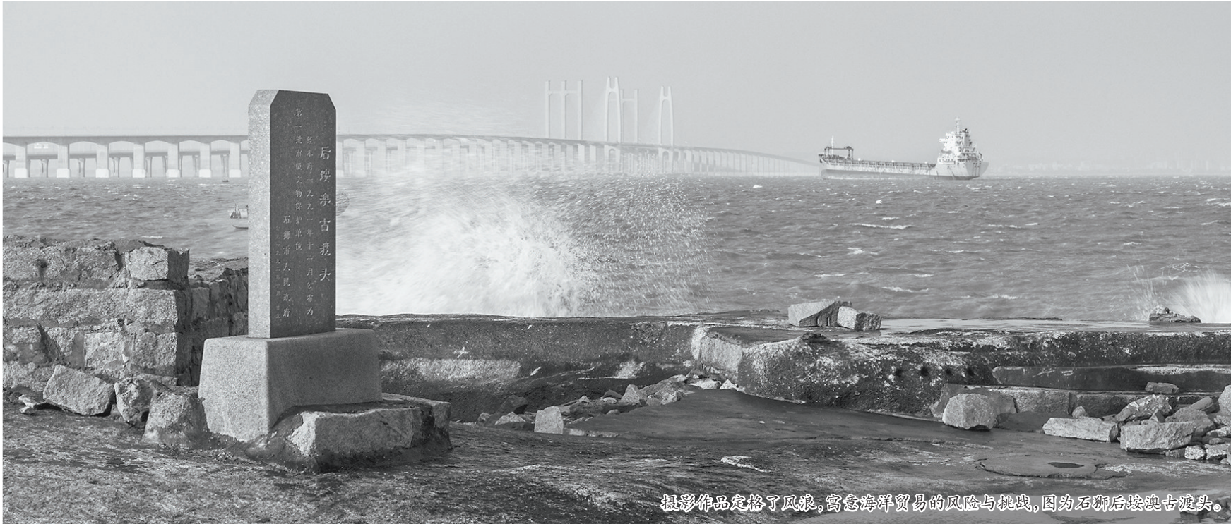
摄影作品定格了风浪,寓意海洋贸易的风险与挑战,图为石狮后澳古渡头。