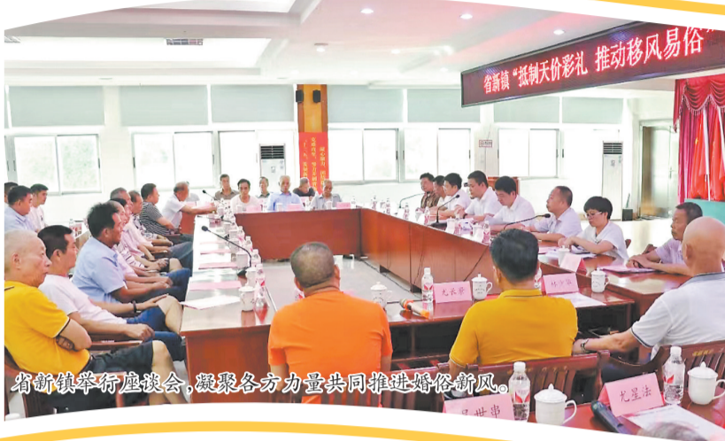
晋江市新桥镇举行婚俗座谈会...