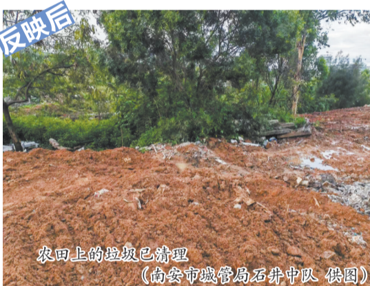
农田上的垃圾已清理

本报讯(融媒体记者张小玲 通讯员黄君峰)南安市石井镇菊江村靠近贤林大道路段有一块农田长期被倾倒垃圾,影响生态环境。上周四,本报对此事进行报道,并将此事转给南安市城市管理局和南安市生态环境局处理,他们均表示会到现场督促解决。昨日,记者获悉,该块农田上的垃圾已清理。