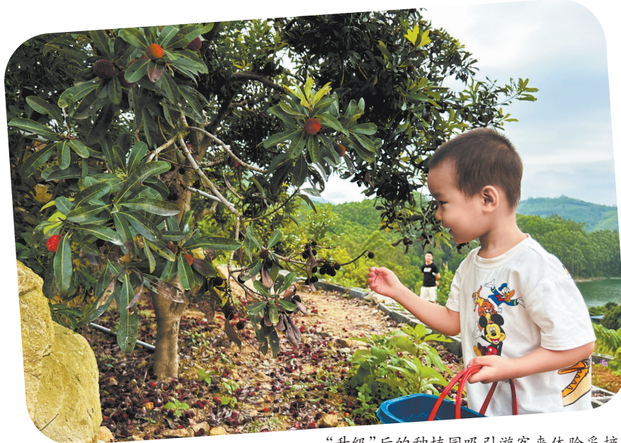
“升级”后的种植园吸引游客来体验采摘