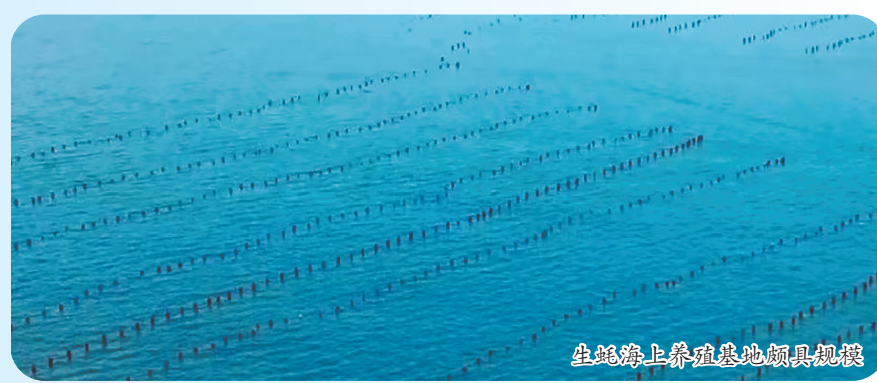
生蚝海上养殖基地颇具规模

“保护好周边的海洋资源环境,其实也是在守护好我们自己的‘钱袋子’。”在当地村民看来,经济发展的同时,生态环境保护也很重要。“我们的牡蛎养殖采用吊养与笼养相结合的方式,养殖基地使用无污染塑胶浮球,不投饵,不用药,符合生态健康养殖要求。”位于该村的一水产科