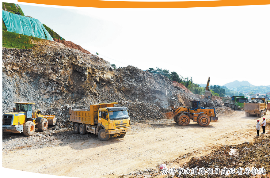
苏洋市政道路项目加快建设有序推进

“目前已完成支路涵洞、排水沟和试验段工程,正在加紧进行主线路基和管线工程施工,预计今年国庆节前实现路面通车。”刘成湖说。项目建成后,将进一步提升城市辐射能力,拓展城市空间,推动省道310线全线贯通,为城东五期规划建设提供前期交通准备,为实现乡村振兴和龙门滩镇的高速发展提供重要的基础