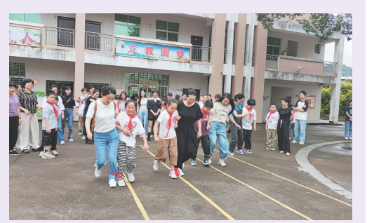
近日,永春县妇联联合多个部门举办“红领巾爱祖国”六一儿童节暨“我们和留守流动、困境儿童在一起”主题关爱活动,走进吾峰中心小学,为孩子们带去价值5000元的体育用品,并开展爱心妈妈“童心结对”,为小朋友准备微心愿礼物,共同开展亲子游园活动,让广大儿童度过一个健康、快乐、有意义的节日。图为活动现场。

理部主任洪斯虞表示,“跨行带押过户”新模式是永春县进一步落实国务院“放管服”改革、更好满足缴存职工刚性及改善性住房需求的惠民便民举措。该模式的实施,有效破解了“筹资难、解押难、风险高、时效慢”等问题,实现了抵押和产权同步转移,减少了交易成本、办事环节和办理时限,提升了二手房交易效率和便利度,促进了二手房市场良性循环和健康发展。(苏榆轴)