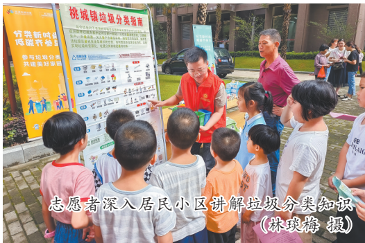
志愿者深入居民小区讲解垃圾分类知识

5月22日至5月28日是第二届全国城市生活垃圾分类宣传周。为进一步提升全民垃圾分类意识,擦亮“有一种生活叫永春”名片,连日来,永春在全县范围内开展了一系列丰富多彩的垃圾分类宣传活动。