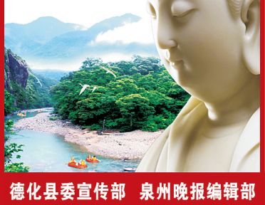
德化县委宣传部 泉州晚报编辑部

今年以来,德化县龙门滩镇紧扣省委深化拓展“深学争优、敢为争先、实干争效”行动部署要求,聚焦县委坚定实施“三大战略”部署,扎实开展“提标增效”活动,大抓经济、大抓发展,进一步推动“临城”向“融城”优势转化,加速推进“城郊型工业强镇”建设。