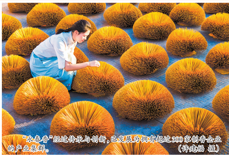
“永春香”经过传承与创新,已发展为拥有超过300家制香企业的产业集群。

同时,“永春香”作为永春县地理标志保护产品,永春县一直注重其品质,并致力于香产业转型发展。近年来,国家香检中心积极发挥国家级检验检测机构技术引领作用,分别在永春达埔、莆田