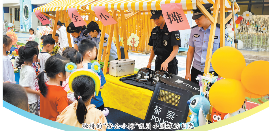
独特的“安全小摊”吸引小朋友们的目光