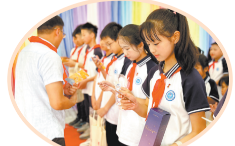
孩子们认真阅读父母的信