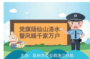
党旗飘扬山路水湾 警风暖千家万户 主办:泉州市公安局洛江分局

懂的语言向小朋友们详细讲解了宣传单上的知识。通过知识讲解、互动问答、趣味游戏等方式,调动小朋友们的关注度和积极性。民警还将警用装备搬进了幼儿园,在保障安全的情况下,让孩子们沉浸式体验,与警用装备来了一次亲密接触。