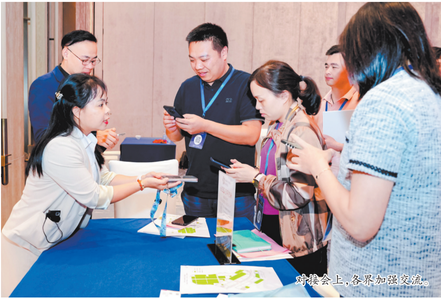
对接会上,各界加强交流。

泉州市商务局相关负责人表示,泉州素来与越南保持较为密切的贸易往来,期待通过这样的交流会,更加深两地的信息、资源畅通对接,进一步助力泉州国潮优品更好地扬帆出海。